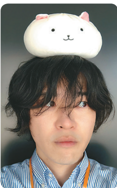
経営情報学部 情報学科卒業

会 期：2018年9月15日（土）～9月17日（祝・月） 時 間：9時～17時（最終日のみ16時まで） 会 場：あわぎんホール（徳島県郷土文化会館） 3階全展示室