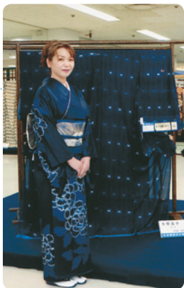
短期大学部 家政科家政専攻服飾コース卒業