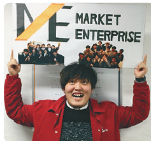
経営情報学部 経営情報学科卒業

日々勉強で大変ではありますが、続けられるのは、この仕事が好きだからなのだと思います。みなさんも、自分が楽しいと思うことで社会に対して何が出来るか想像して、好きなことを仕事に活かしていけるよう頑張ってください。