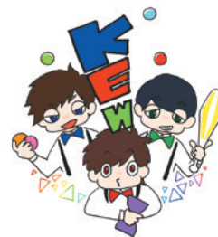
生活科学部 管理栄養士養成課程卒業

最後に私が一番伝えたいのは、色々な視点で、色々な角度から物事を見て、色々なことに挑戦してください。自分の可能性は思っている以上に大きいものです。自ら可能性を潰すのではなく、目を背けず色々なことに挑戦して自分の持つ可能性を広げていってください。